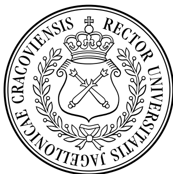
Pieczęć mniejsza Uniwersytetu Jagiellońskiego (średnica 45 mm)