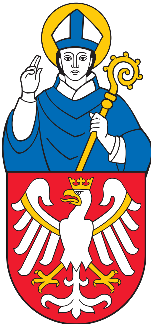
Wzór tradycyjnego herbu Uniwersytetu Jagiellońskiego