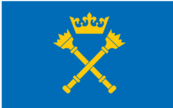
Wzór flagi Uniwersytetu Jagiellońskiego