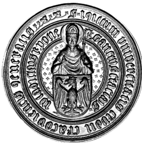
Pieczęć wielka Uniwersytetu Jagiellońskiego (średnica 65 mm)